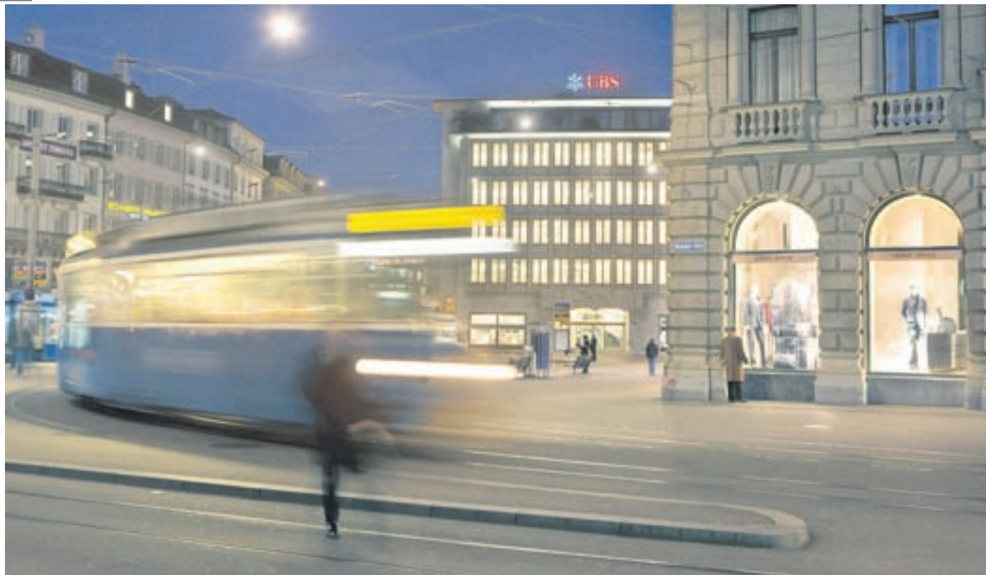
Paradeplatz in Zürich. Die Krise hält den Finanzplatz auf Trab.

Wir sind auf jeden Fall bereits mittendrin in diesem Domino-Spiel. Jetzt geht es darum zu verhindern, dass noch weitere Domino-Steine umfallen. In