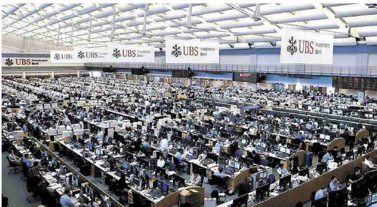
Erneut wird die Investment Bank der UBS – hier der US-Ableger in Stamford, Connecticut – von einem Skandal erschüttert.

ist ordentlicher Professor für Finance an der Universität St. Gallen und Direktor des Schweizerischen Instituts für Banken und Finanzen. (du)