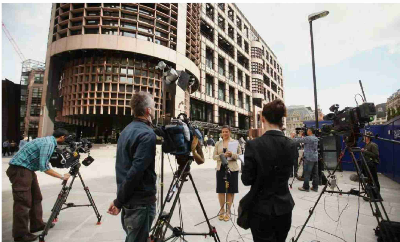
Grosses Medieninteresse vor dem UBS-Gebäude in London: In diesem Bürokomplex arbeitete der 31-jährige Banker, der zwei Milliarden Dollar verspekulierte. Die Londoner Polizei verhaftete ihn am frühen Donnerstagmorgen wegen Betrugsverdachts. Der Mann ist derzeit in Polizeigewahrsam.

Themen-Nr.: 377.9 Abo-Nr.: 377009 Seite: 14 Fläche: 119'161 mm 2