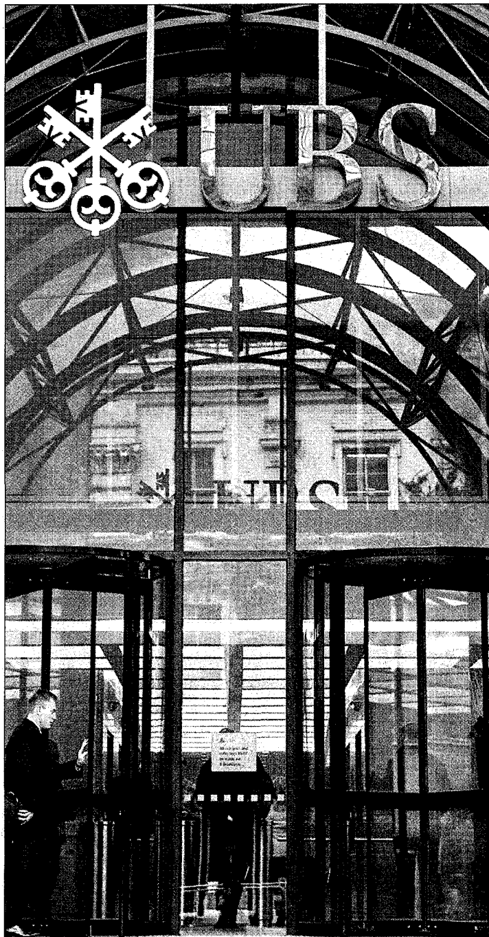
Misstrauische Kunden: Die UBS kämpft um ihre Glaubwürdigkeit.